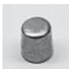
Końcówka samochodowa (AP)