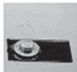
Końcówka dla przycisków