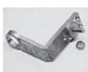
Końcówka dla autobusów (BT)