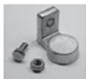
Końcówka „L” (LT)

Podane wartości elektryczne obowiązują dla naładowanych akumulatorów oraz temperatury otoczenia 20° C.